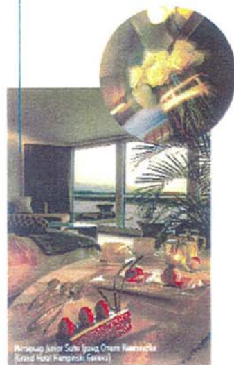
Интерьер Junior Suite (Grand Othman Kempinski Grand Hotel Kempinski Geneva)

Идея взаимосвязи внутреннего пространства с внешним миром подчеркивает система коммуникаций – все номера оснащены системой кондиционирования, телефоном с голосовой почтой, плазменным TV со спутниковым вещанием и платными каналами, а также высокоскоростным доступом в Интернет.