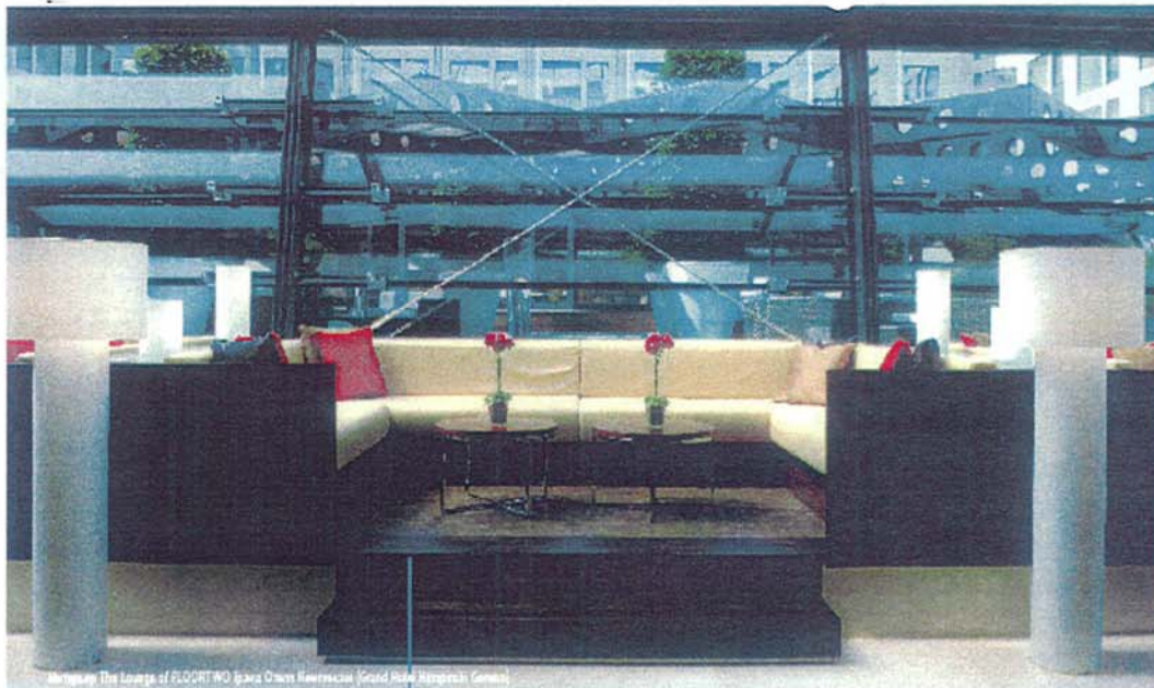
Интерьер The Lounge at FLOOR 10 (Grand Hotel Kempinski Geneva)