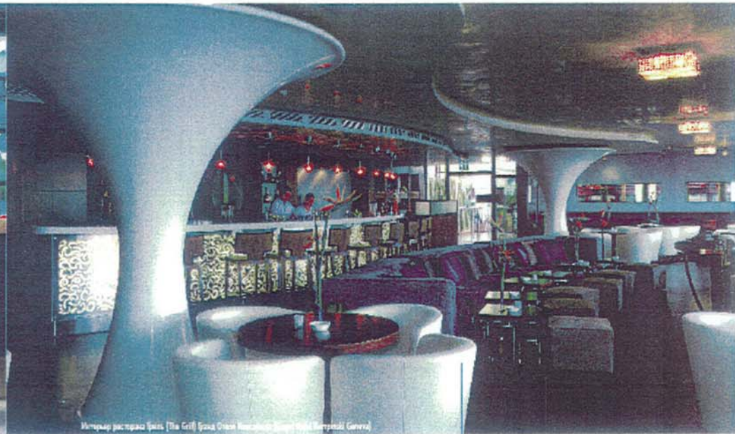
Интерьер ресторана Grill (The Grill) Grand Hotel Kempinski Geneva

Второй этаж Grand Hotel Kempinski Geneva целиком отдан под рестораны: The Restaurant, лаунж The Lounge, бар The Bar и ресторан-гриль The Grill. Разнообразие гастрономических предложений объединяет великолепный вид на озеро, открывающийся из всех общественных зон отеля.