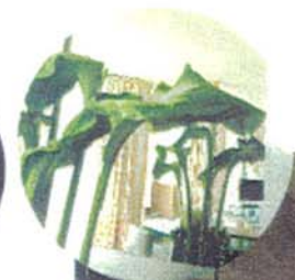
Интерьер ванной комнаты саун