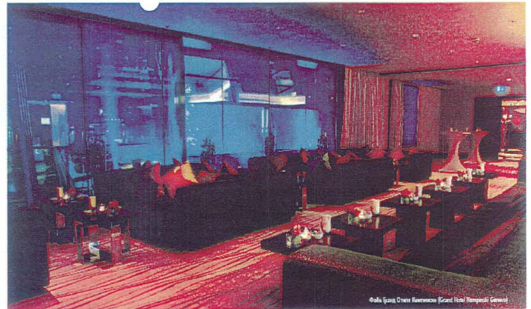
Folia Grand Hotel Kempinski (Grand Hotel Kempinski Geneva)