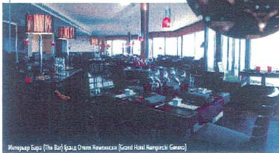
Интерьер бара (The Bar) Grand Hotel Kempinski Geneva

Терраса является естественным продолжением бара и ресторана. Летом большие стеклянные двери раздвигаются, и гости отеля наслаждаются травесой и напитками в непосредственной близости от озера.