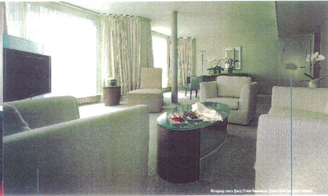
Интерьер саун: Франц Штайр, Невшаталь (Grand Hotel Kempinski Geneva)